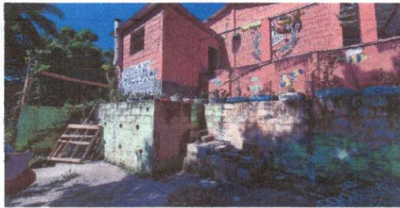
Foto 9: LUGAR QUE SE COLOCARÁ LA ESTRUCTURA METÁLICA PARA COLOCAR LÁMINA Y HABILITAR ESTA ÁREA