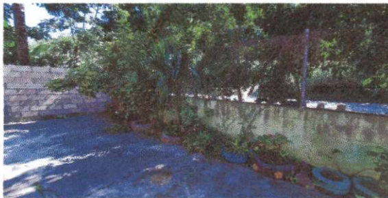
Foto 11: SE COLOCARÁ LA ESTRUCTURA METÁLICA Y LA LÁMINA EN ESTA ÁREA