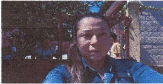
Foto1: EVALUADORA EN EL INGRESO DE LA ESCUELA