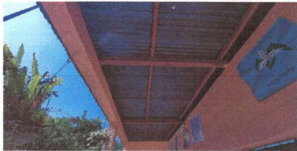
Foto 6: LÁMINA DE PASILLO QUE NECESITA SER CAMBIADA, SE COLOCARA LÁMINA NUEVA

[Handwritten signature] DIRECCIÓN DE PADRES DE FAMILIA DE EORM CASERIO LA COYOTERA SANARATE, EL PROGRESO